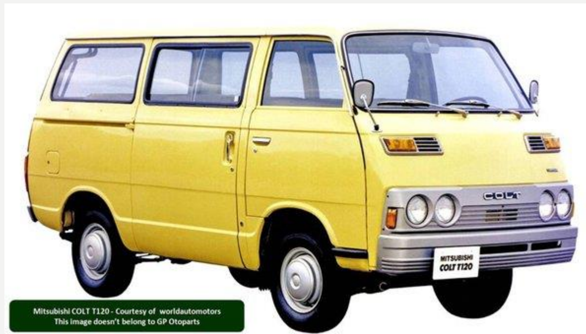
Mitsubishi COLT T120 - Courtesy of worldautomotors This image doesn't belong to GP Otoparts